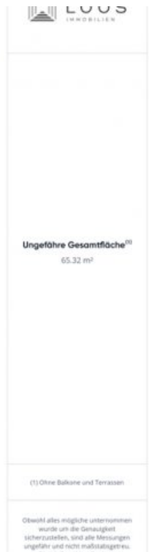
Grundriss EG (Grundriss)