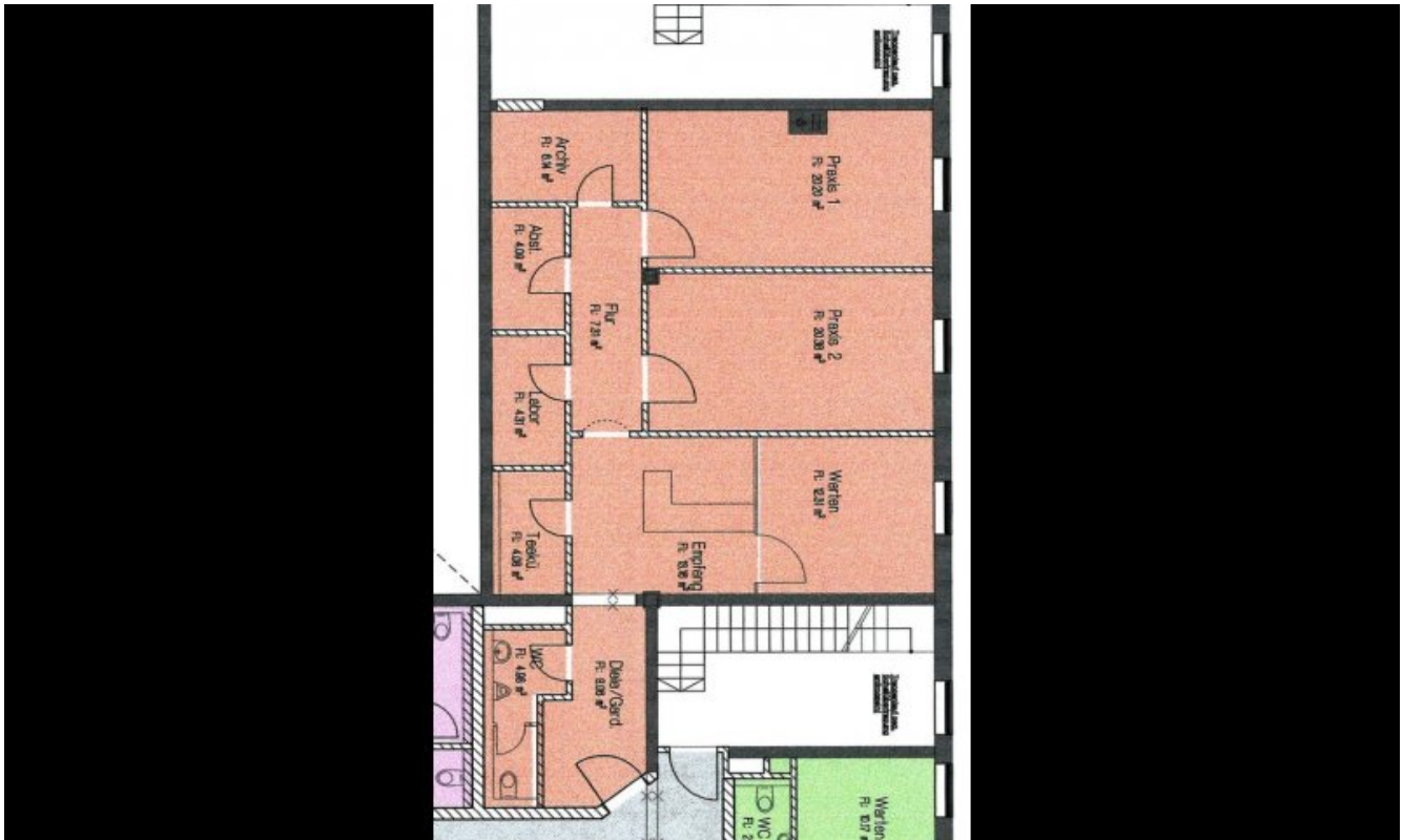
GR - Büro 1 OG - Teil 2 (Grundriss)