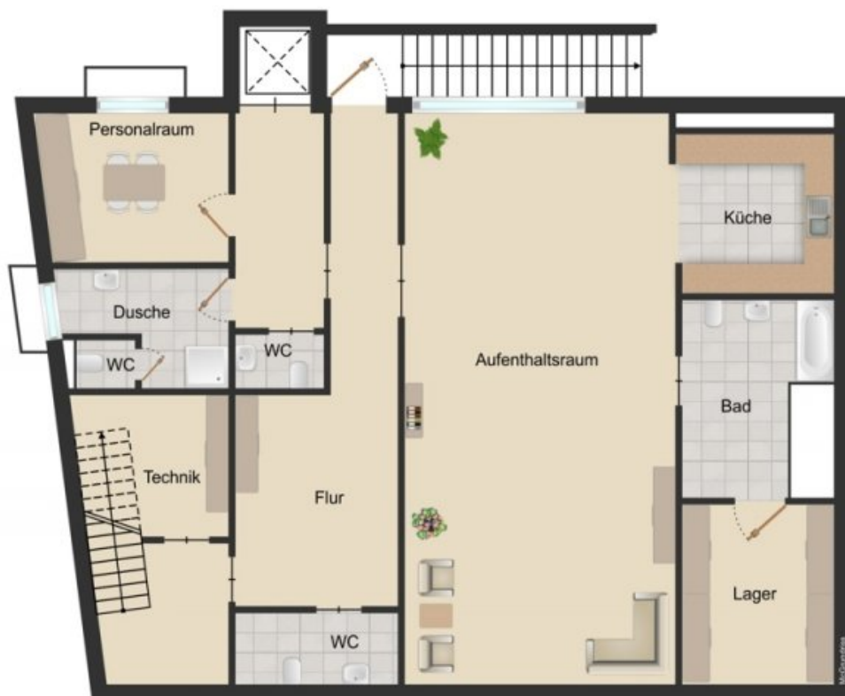
Grundriss Untergeschoss (Grundriss)