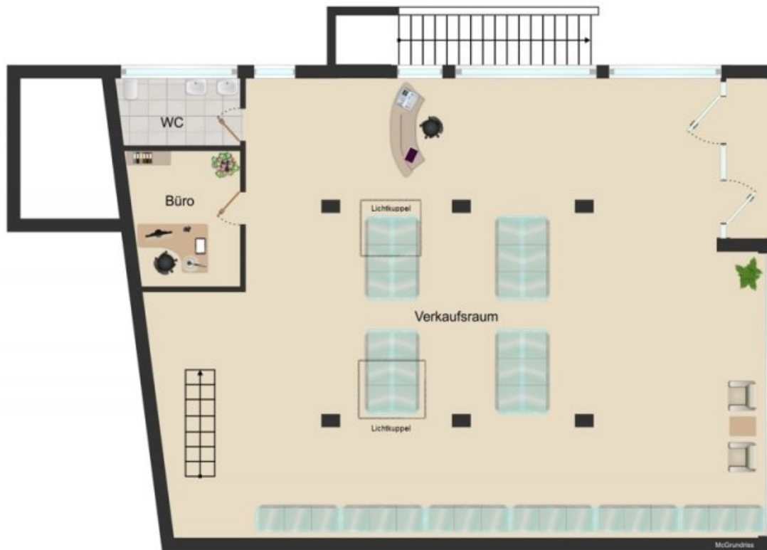
Grundriss Erdgeschoss (Grundriss)