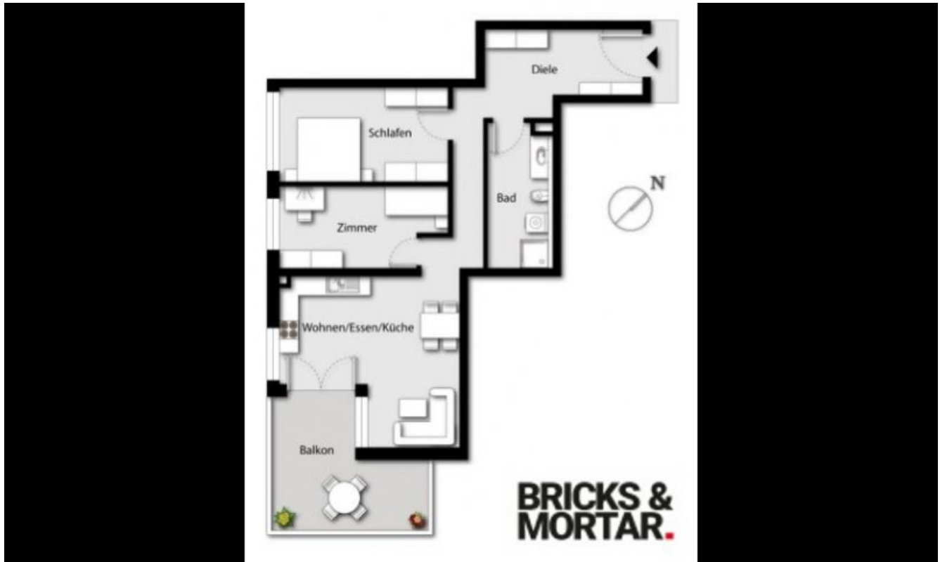
Wohnung 2 (Grundriss)