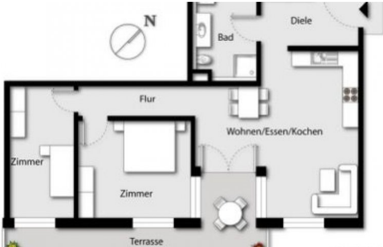
Wohnung 13 (Grundriss)