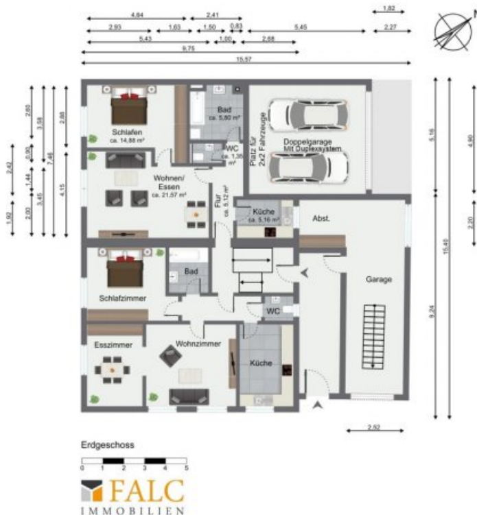
Mögliches Erdgeschoss (Grundriss)