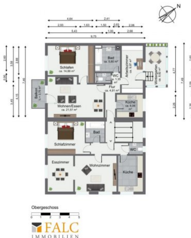
Mögliches Obergeschoss (Grundriss)