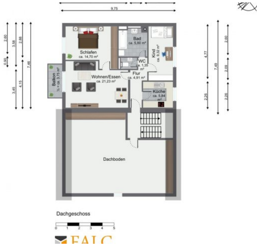
Mögliches Dachgeschoss (Grundriss)