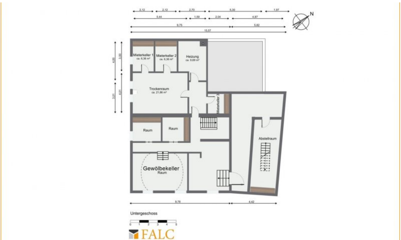
Mögliches Untergeschoss (Grundriss)