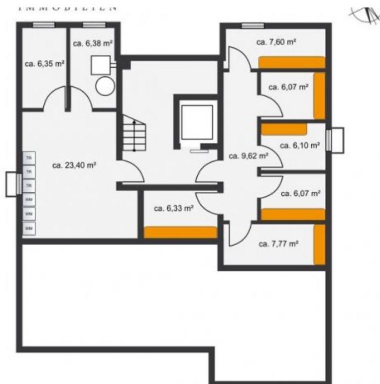
Grundriss Keller (Grundriss)