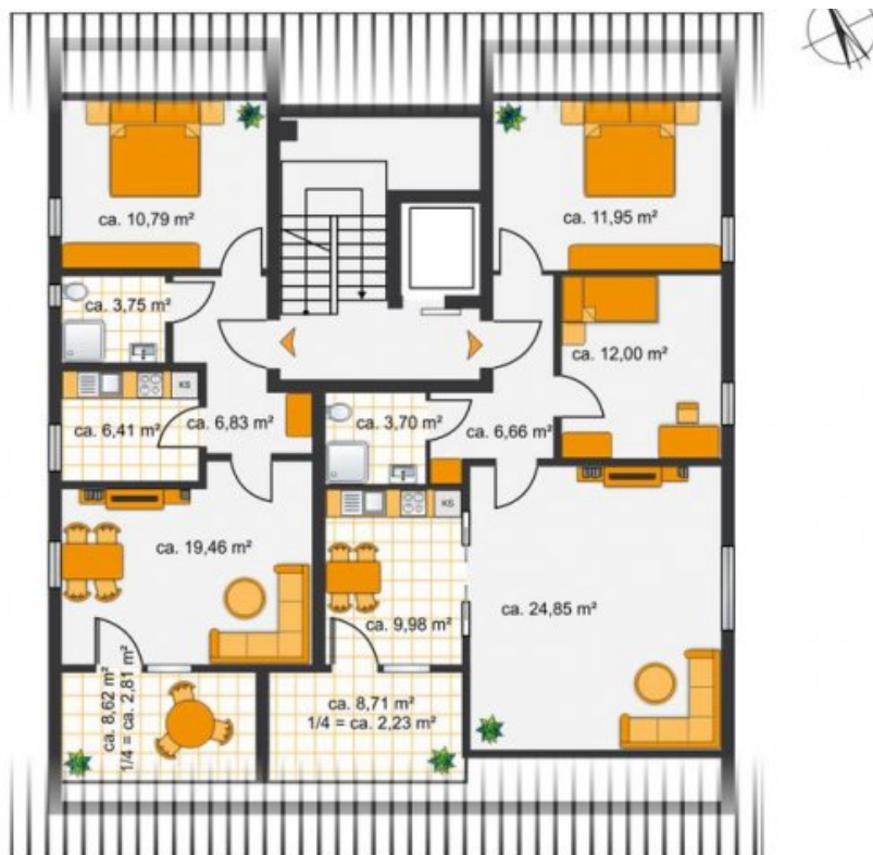
Grundriss DG (Grundriss)