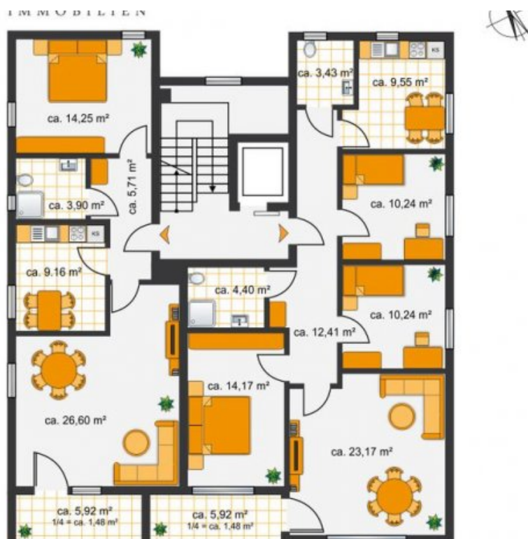
Grundriss OG (Grundriss)