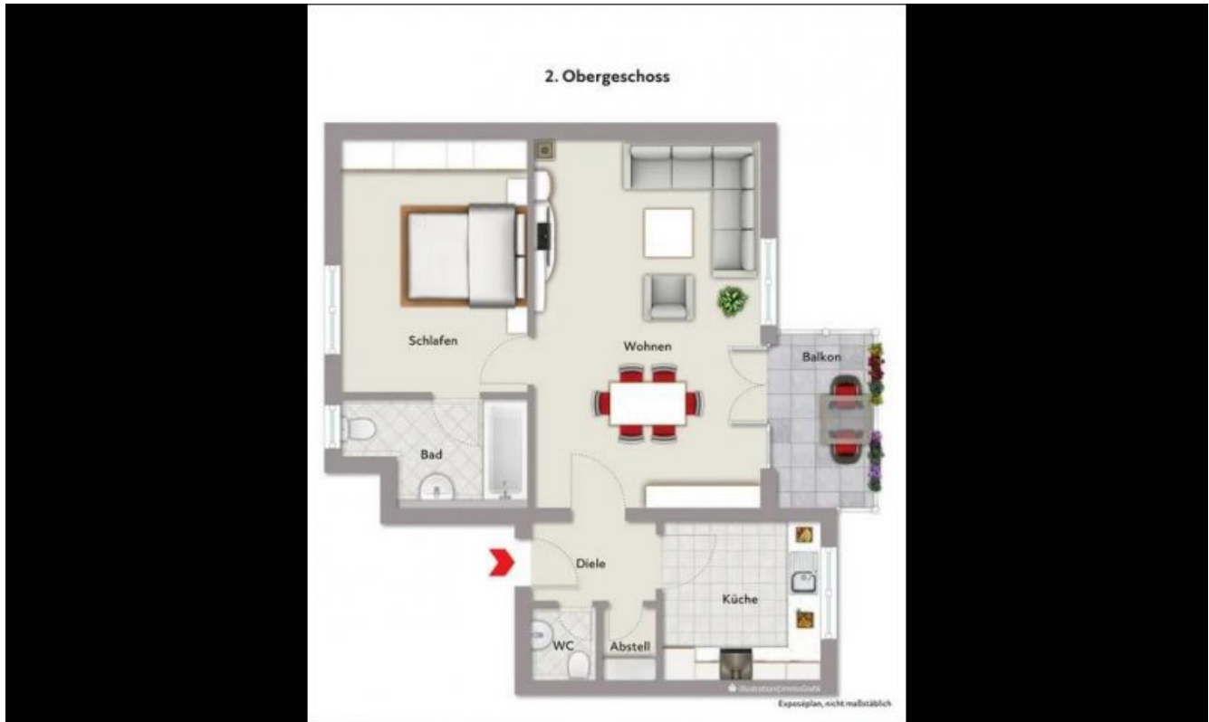
Grundriss Exposeplan (Grundriss)